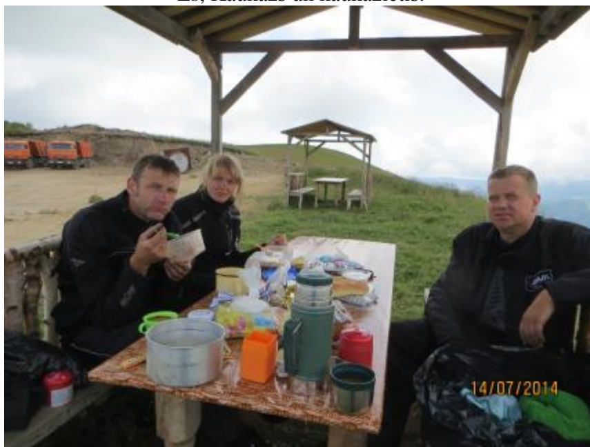
Pusdienas brīvā dabā.