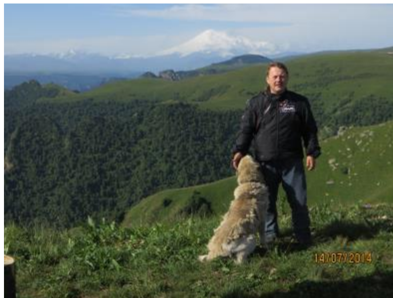
Es, Kaukāzs un kaukāzietis.