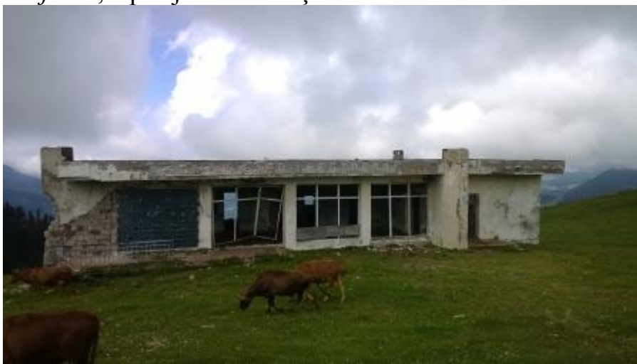
Govis pie kādreizējā restorāna.

Kalnu lopkopju nabadzīgie ciematiņi ar dīvainām mājiņām, govīs, aitas. Pilns ceļš ar tām „ Gaujas fekālijām ”, tāpēc jātur acis vaļā.