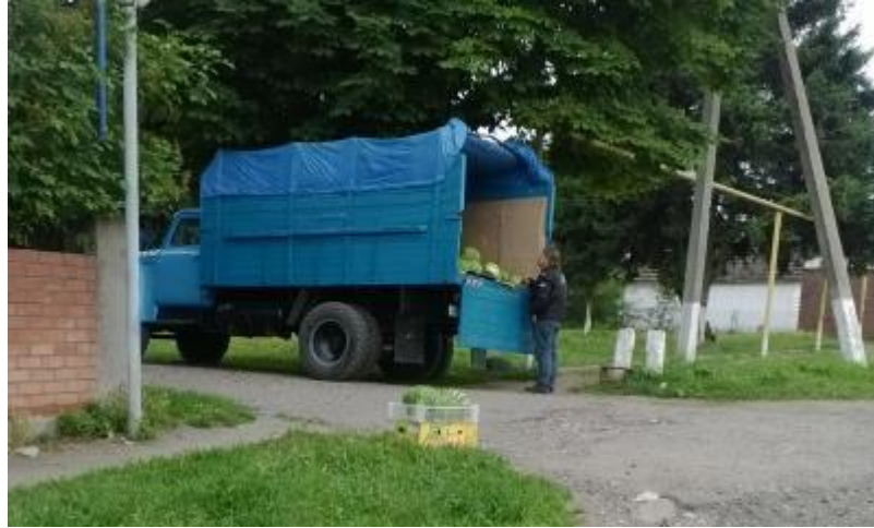
Tiek iepirkts arbūzs.

sabēdājās un viņa pamodās Šumahers. Mašīna pa gaisu, muca pa gaisu, kaut kādas sūdainas šļūtenes pa gaisu, un šis ir mums garām! Jā, izturīgus dzelžus kādreiz ražoja. Vienā miestā piestājam, kur nopērku arbūzu vakariņām.