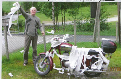
Daudz laimes vārda dienā. Tavajawa!

Ko jāvisti dara ziemā? Skrūvē un pucē, lai aprīlī atkal atklātu sezonu, turklāt gaidāmo vasaru čehu tehnikas cienītāji gaidīs ar sevišķu saviļņojumu, jo galamērķis ir Anglija. Valsts Eiropā, kura lepojas ar lielāko un senāko Jawa klubu, kurš šogad svinēs 60 gadu jubileju. Iespaidīgi! Balle būs, jo šo notikumu ieradīsies atzīmēt teju katras valsts pārstāvji. AE